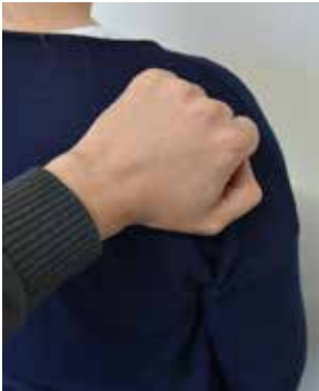
► Das Kreisen mit der Faustseite auf Rücken oder Unterarm bedeutet „Kaffee“.

Die Blindenschrift ist ein Kommunikationssystem, das es blinden Personen ermöglicht zu lesen und zu schreiben. Es besteht aus einer Gruppe von 6 Punkten, die in zwei senkrechten Dreierreihen angeordnet sind. Einer oder mehrere dieser Punkte sind jeweils etwas erhaben, sodass sie mit den Fingern ertastet werden können.